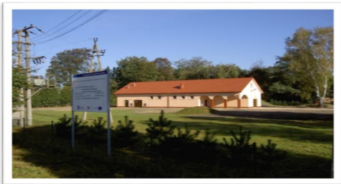
Stacja Uzdatniania Wody w Kąkolewnicy

Zgodnie z decyzją wydaną przez Państwowe Gospodarstwo Wodne Wody Polskie cena za dostarczoną wodę wynosi 1,81 zł/m 3 brutto do 10.06.2021 roku, po wynosi 1,86 zł/m 3 brutto, a za odprowadzanie ścieków 6,05 zł/m 3 brutto do 10.06.2021 roku, po wynosi 6,06 zł/m 3 brutto. W 2021 roku pobrano 268 513 m 3 wód podziemnych.